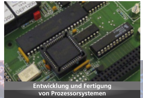
Entwicklung und Fertigung von Prozessorsystemen