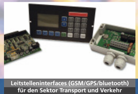
Leitstelleninterfaces (GSM/GPS/bluetooth) für den Sektor Transport und Verkehr

Seit der Gründung im Jahre 1991 durch die Familie Hitpaß stehen die Namen SYSTEM PRINT und BK Industrieelektronik europaweit für Qualität. Schnelle und flexible Lösungen für sich ständig verändernde Marktanforderungen stellen den Wachstumsmotor des Unternehmens dar.