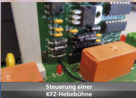
Steuerung einer KFZ-Hebebühne