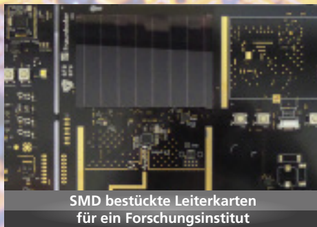
SMD bestückte Leiterkarten für ein Forschungsinstitut