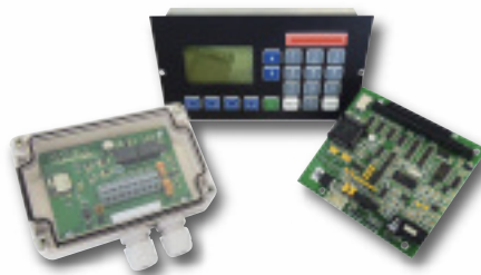
Prototypen & Kleinserien