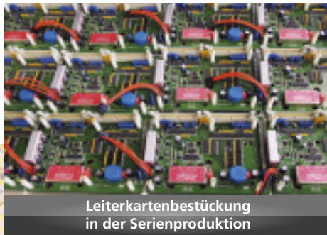
Leiterkartenbestückung in der Serienproduktion