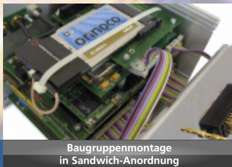
Baugruppenmontage in Sandwich-Anordnung