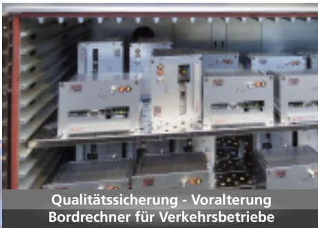
Qualitätssicherung - Voralterung Bordrechner für Verkehrsbetriebe

Gerne übernehmen oder unterstützen wir die mechanische und elektronische Fertigung Ihrer Produkte. Wir begleiten Sie von der Idee über die Entwicklung mit all ihren Bedingungen bis hin zum serienreifen Endprodukt.