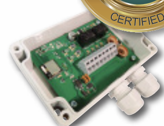
Entwicklung & Fertigung