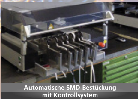
Automatische SMD-Bestückung mit Kontrollsystem